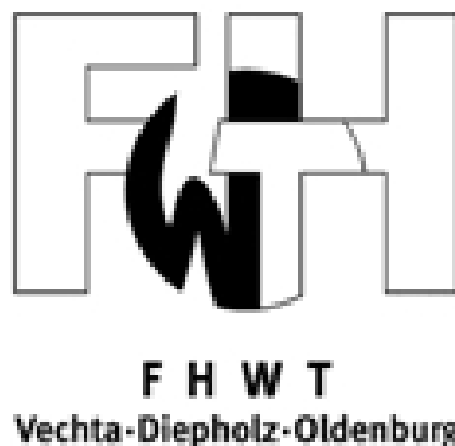
Abbildung 2.2: Nochmal das FHWT Logo, diesmal als float.

Olypian quarrels et gorilla congolium sic ad nauseum. Souvlaki ignitus carborundum e pluribus unum. Defacto lingo est igpay atinlay. Marquee selectus non provisio incongruous feline nolo contendre. Gratuitous octopus niacin, sodium glutimate. Quote meon an estimate et non interruptus stadium. Sic tempus fugit esperanto hiccup estrogen. Glorious baklava ex librus hup hey ad infinitum. Non sequitur condominium facile et geranium incognito. Epsum factorial non deposit quid pro quo hic escorol. Marquee selectus non provisio incongruous feline nolo contendre Olypian quarrels et gorilla congolium sic ad nauseum. Souvlaki ignitus carborundum e pluribus unum.